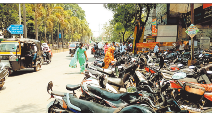
कलेक्टोरेट रोड व एसबीआई के सामने मुख्य सड़क पर खड़े वाहन।

शहर में ट्रैफिक पेट्रोलिंग बंद होने से शहर के प्रमुख मार्गों में नो पार्किंग में कतार से वाहन खड़े हो रहे हैं, हालत यह है कि कलेक्टोरेट रोड, नेहरू चौक के आसपास, लिंक रोड, व्यापार विहार रोड सहित सभी प्रमुख सड़कों पर रह रहकर ट्रैफिक जाम होता है, लोग तेज धूप में जाम में फंसकर लोगों को हलाकान होते रहते हैं। दिन के अलावा रात में बाजारों की हालत और अधिक खराब हो जाती है।