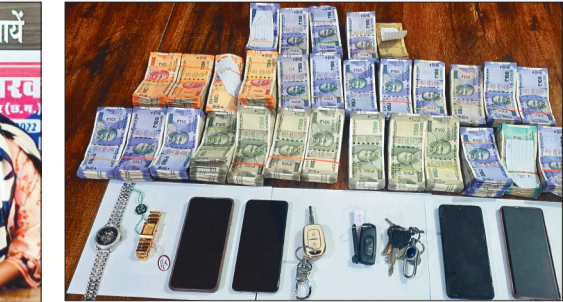
आरोपियों से जब्त राशि सहित मोबाइल और अन्य सामग्री।