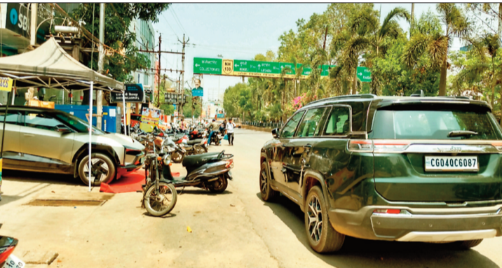
नेहरू चौक के पास सड़क पर बिक रही कार।

ट्रैफिक पुलिस ने यातायात व्यवस्था सुधारने के लिए शहर को चार जोन में बांटा था, चारों जोन में अलग अलग पेट्रोलिंग गाड़ी व लिफ्टर उपलब्ध कराए गए थे। पूर्व में ट्रैफिक पेट्रोलिंग पार्टी शहर में गश्त कर नो पार्किंग में खड़े होने वाले वाहनों को एनाउंस कर हटवाया करती थी। वहीं बेतरतीबी से खड़े वाहनों को लिफ्ट कर मोटर व्हीकल एक्ट के तहत कारवाई की जाती थी, इससे व्यवस्था सुधारने लगी थी, लेकिन धीरे धीरे गश्त बंद हो गई। लंबे समय से शहर में ट्रैफिक पेट्रोलिंग पार्टी गश्त करते नजर नहीं आ रही है, नो पार्किंग में खड़े वाहनों को लिफ्ट भी नहीं किया जा रहा है। इसका नतीजा यह है कि एकबार फिर सड़कों के दोनों किनारों पर चार पहिया व दो पहिया वाहन खड़े नजर आ रहे हैं। इससे पड़ियों पर चलने वालों को भारी परेशानियों का सामना करना पड़ रहा है।