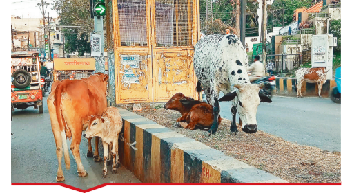
देवकीनंदन चौक पर स्थित डिवाइडर पर मोशियों का जमावड़ा।

बिल्हा | मस्तूरी | तखतपुर | मुंगेली | कोटा | लोरनी | सरगांव | पेंड़ा | बेलतरा | रतनपुर | पथरिया