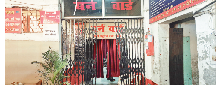
पड़ रहा है, वॉटिलेशन की समस्या होने के कारण सीपेज और दुर्गंध मरीजों को सहनी पड़ती है। छत खराब होने के कारण बारिश के दिनों में सीपेज की समस्या भी आम बात है।

सिम्स में एक साल के भीतर वार्डों का कायाकल्प हो रहा है, लगातार एक के बाद एक वार्ड संवारे जा रहे हैं, जिससे सिम्स का सूरत ए हाल दिन बद दिन बदल रहा है। ट्राइएज, इमरजेंसी के बाद अब बर्न वार्ड को भी संवारने का बीड़ा उठाया जा रहा है। प्रबंधन 20 बेड के बर्न वार्ड में जल्द ही निर्माण कार्य शुरू कराएगा।