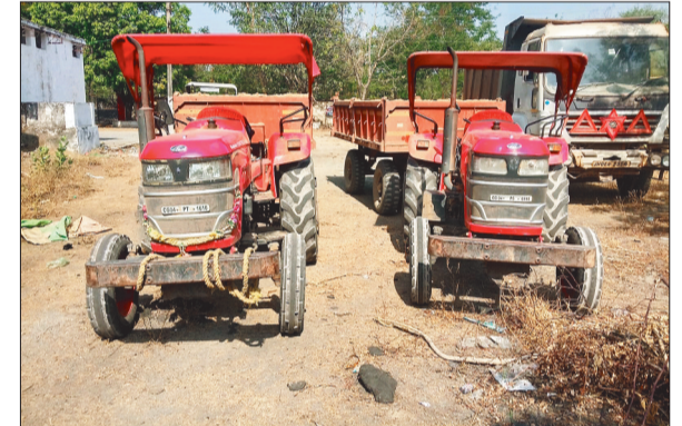
खनिज विभाग ने किया ट्रैक्टर जब्त।